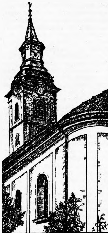
A kőröstarányi templom