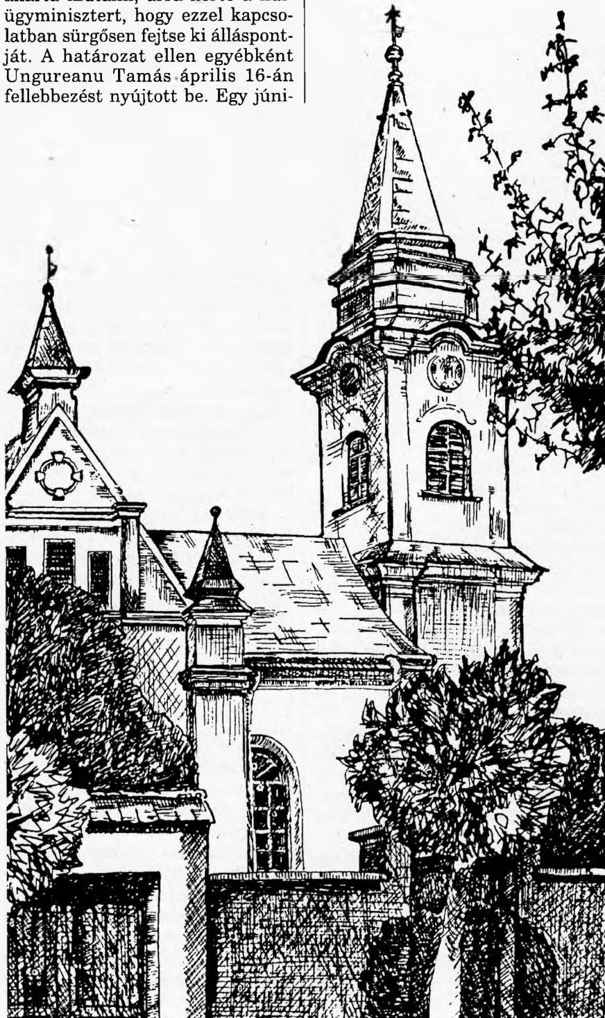
A belényesi templom