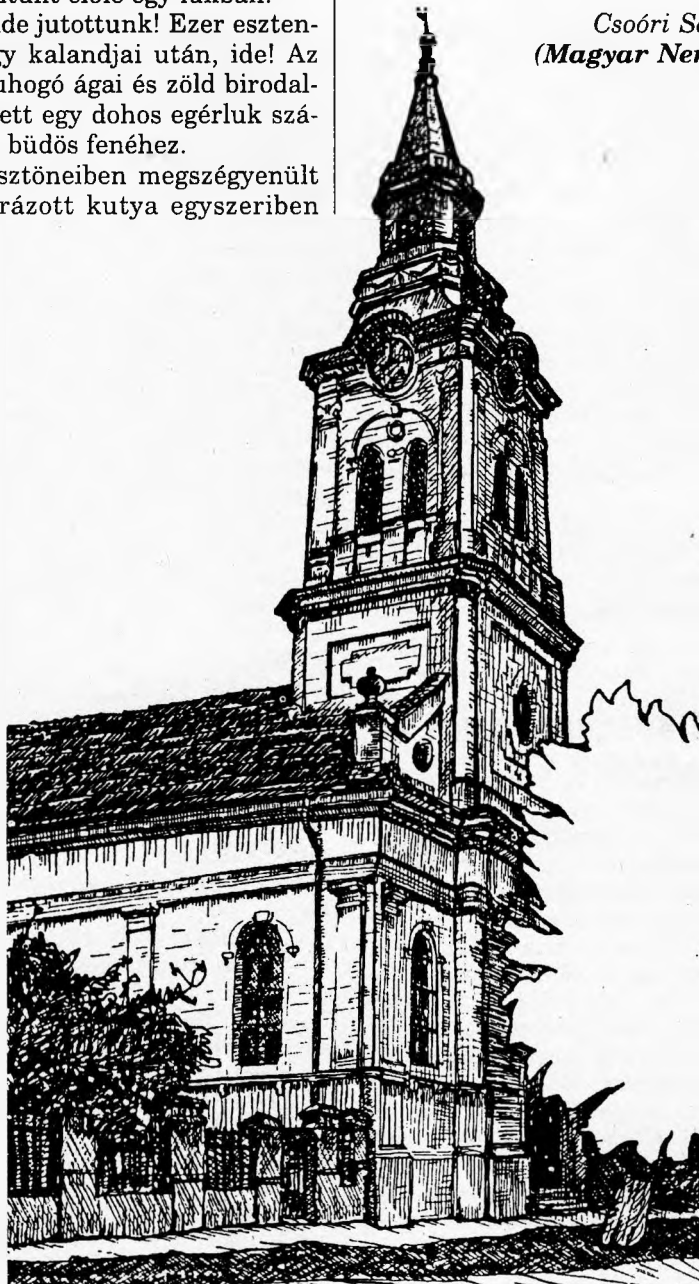
A tenkei templom

Megalakulásának 10. évfordulója alkalmából az Erdélyi Szövetség 1998. november 22-én várja tagjait és barátait a Magyarok Világszövetségében tartandó megemlékezésre. (1052 Budapest, Semmelweis u. 1-3.)