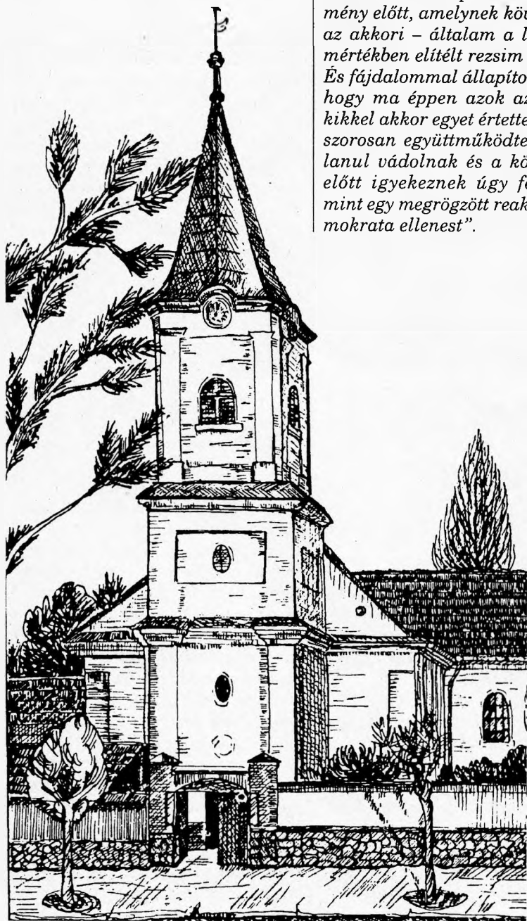
A várasfenesi templom

Ebben az időben én hazaáruló, zsidó bérenc, kommunista és orosz barátként szerepeltem a közvélemény előtt, amelynek következtében az akkori – általam a legteljesebb mértékben elítélt rezsím – üldözött. És fájdalommal állapítom meg azt, hogy ma éppen azok az emberek, kikkel akkor egyet értettem és velük szorosán együttműködtem, alaptalanul vádolnak és a közvélemény előtt igyekeznek úgy feltüntetni, mint egy megrögzött reakciót és demokrata ellenest".