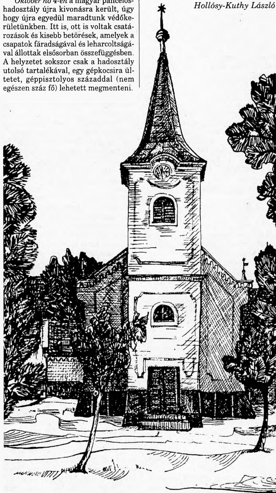
A kisnyégerfalvai templom