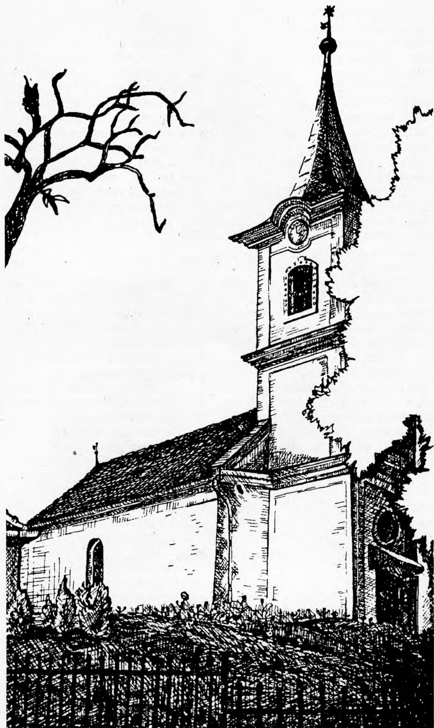
A belényesújlaki templom