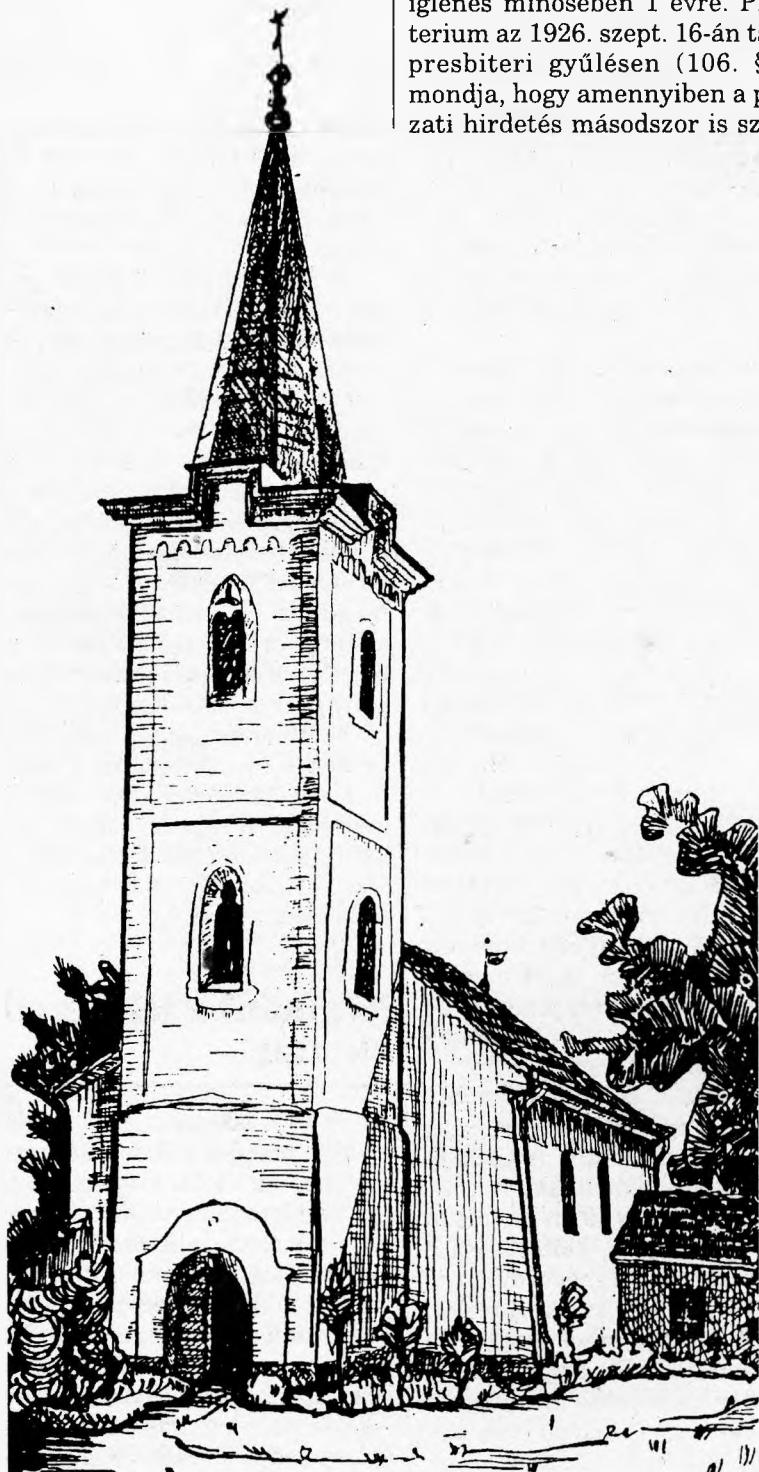
A magyarremetei templom